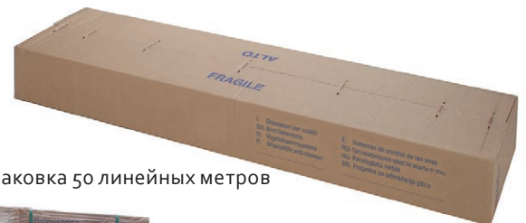
упаковка 50 линейных метров