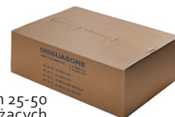
opakowanie m 25-50 bieżących