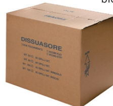
opakowanie m 50-100 bieżących