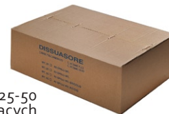
opakowanie m 25-50 bieżących