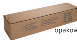
opakowanie m 25 bieżących