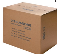
opakowanie m 50-100 bieżących