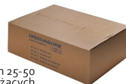
opakowanie m 25-50 bieżących