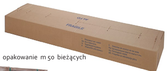
opakowanie m 50 bieżących