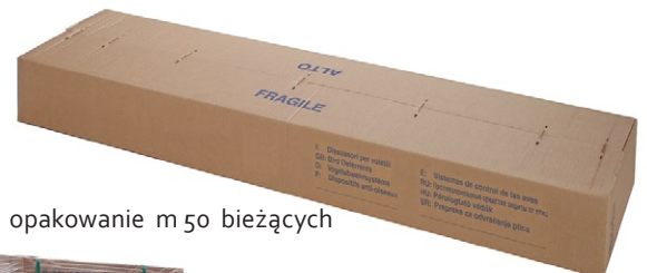
opakowanie m 50 bieżących