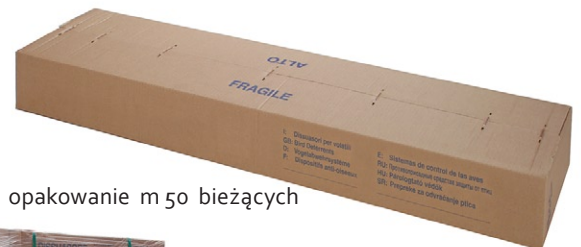
opakowanie m 50 bieżących