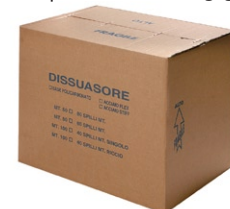
opakowanie m 50-100 bieżących