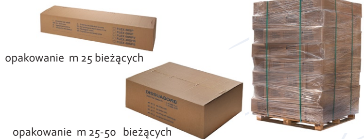
opakowanie m 25 bieżących