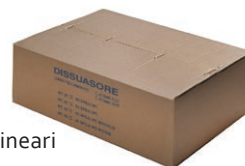
confezione m 25-50 lineari