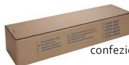
confezione m 25 lineari