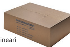
confezione m 25-50 lineari