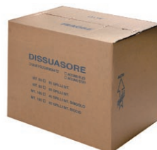
confezione m 50-100 lineari