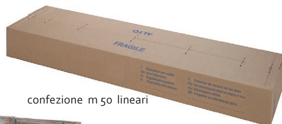
confezione m 50 lineari