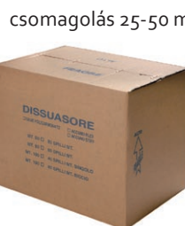
csomagolás 25-50 m, lineáris