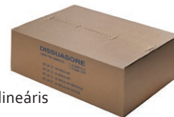
csomagolás 25-50 m, lineáris