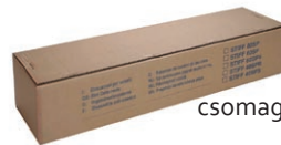
csomagolás 25 m, lineáris