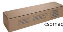
csomagolás 25 m, lineáris