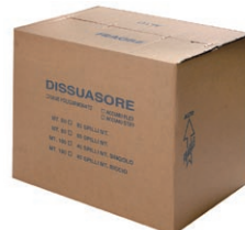
csomagolás 50-100 m, lineáris