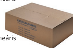
csomagolás 25-50 m, lineáris