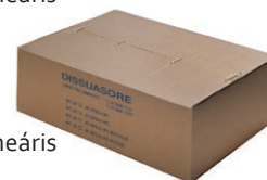
csomagolás 25-50 m, lineáris