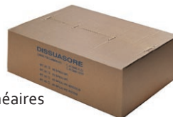
emballage 25-50 m linéaires