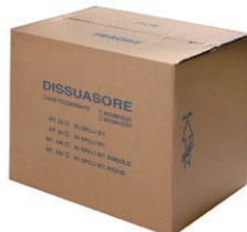
emballage 50-100 m linéaires