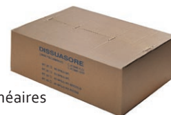
emballage 25-50 m linéaires