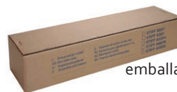
emballage 25 m linéaires