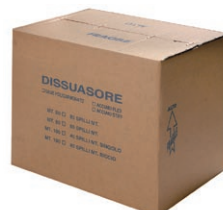
emballage 50-100 m linéaires