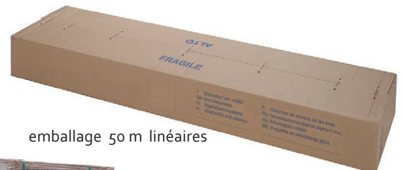
emballage 50 m linéaires