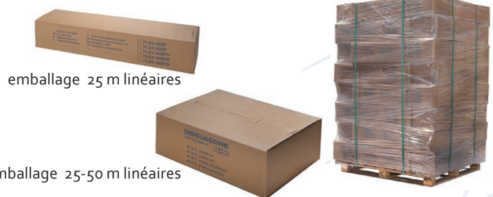
emballage 25 m linéaires