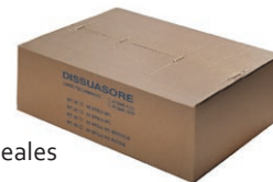
paquete m 25-50 lineales