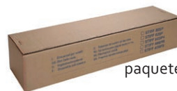
paquete m 25 lineales