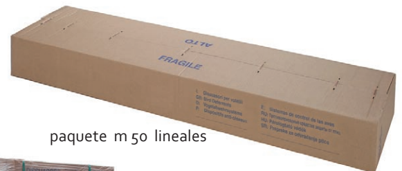
paquete m 50 lineales