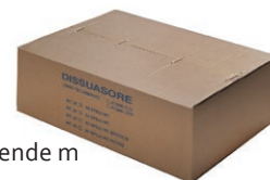
Packung 25-50 laufende m