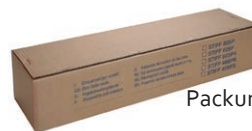
Packung 25 laufende m