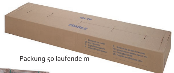
Packung 50 laufende m