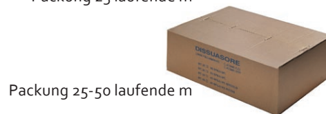
Packung 25-50 laufende m